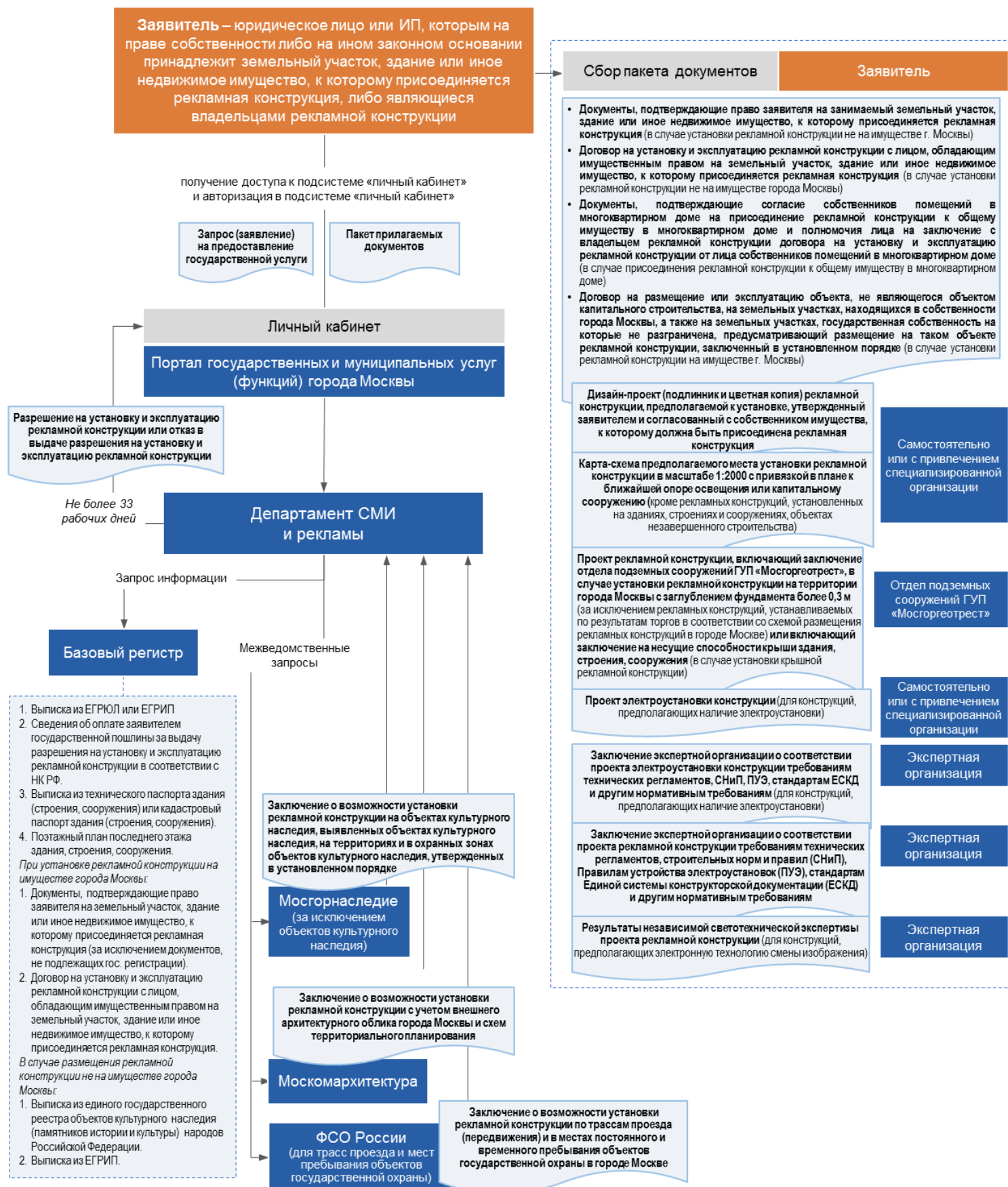
Рисунок 1 – Схема предоставления государственной услуги «Выдача разрешения на установку и эксплуатацию рекламной конструкции»